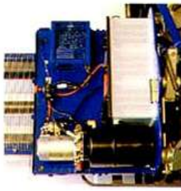
All the primary components, hydraulic power unit, battery and charger are gathered and placed inside a frame case made of plate and shock resistant AISI according to the regulations in force.

Any maintenance intervention is made easier by a practical bodywork opening system, which allows the access to the machine body without having to face any obstacles.