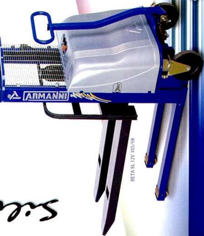
BETA SL 12V 105/08