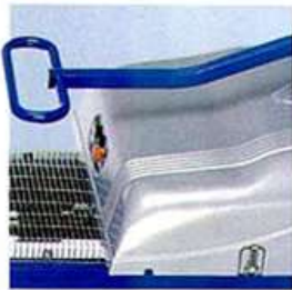
The special hand steering offer allows an easy and manageable handling of the lift truck.

Several optionals are available besides the standard ones. Stapler auch in Sonderbau lieferbar.