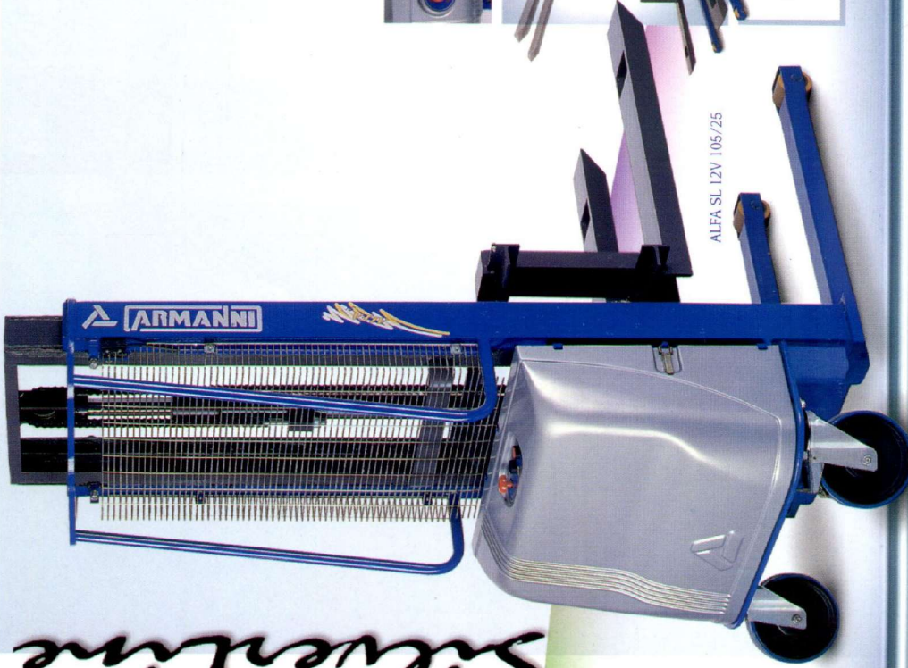
ALFA SL 12V 105/25