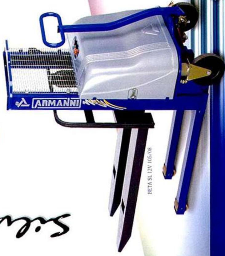
BETA SL 12V 105/08

Several optionals are available besides the standard ones. Stapler auch in Sonderbau lieferbar.